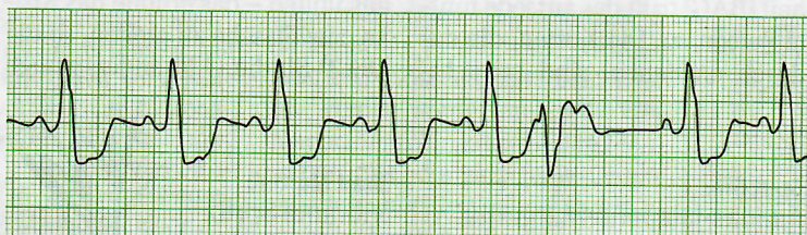
Das Elektrokardiogramm zeigt Kurvenzyklen, die ein Kardiologe lesen kann.

«Die natürliche Alterung beginnt bereits mit 20»