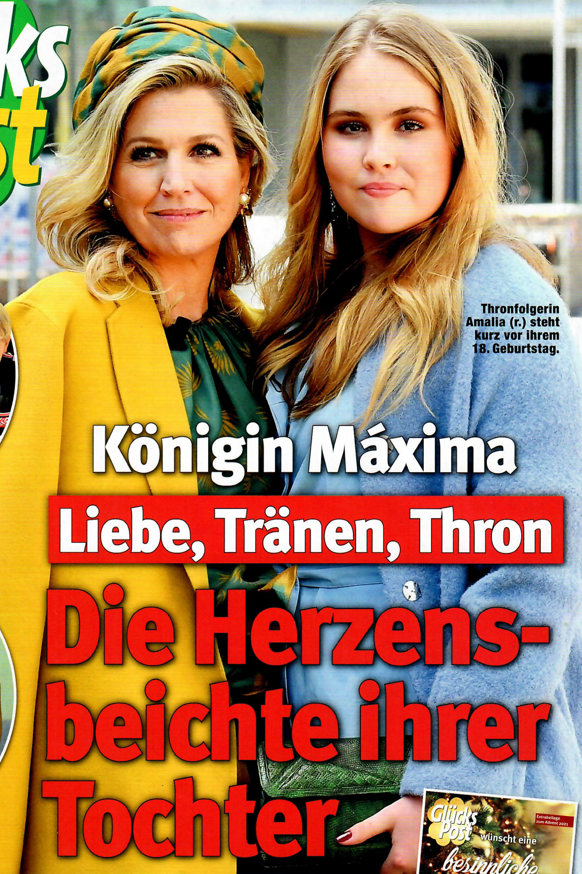
Thronfolgerin Amalia (r.) steht kurz vor ihrem 18. Geburtstag.